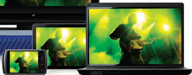
Кодек StreamZ Live Broadcast