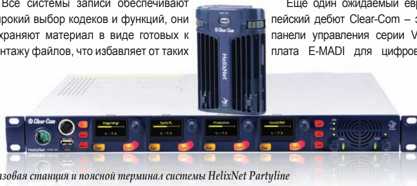
Базовая станция и поясной терминал системы HelixNet Partyline

Все системы записи обеспечивают широкий выбор кодеков и функций, они сохраняют материал в виде готовых к монтажу файлов, что избавляет от таких