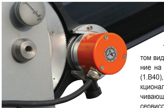
Кодек положения стрелы крана Egriment

Что касается виртуальной реальности, то тут речь идет о комплекте трекинга на базе кодеков для студий, полностью или частично виртуальных. Этим комплектом могут оснащаться различные краны Egriment, включая TDT, а также дистанционно управляемые головки 305/306. Кроме того, оптические кодеры можно устанавливать и на рельсовых тележках. Комплект кодеков совместим с движками визуализации таких компаний, как VIZRT, ORAD, Brainstorm и Ventuz. Обеспечение совместимости с движками других производителей не составляет труда.