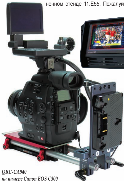
QRC-CA940 на камере Canon EOS C300

Еще один ожидаемый европейский дебют Clear-Com – это панель управления серии V и плата E-MAD1 для цифровой