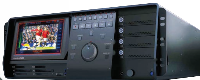
Новый рекордер Cinedeck MX

наиболее интересной новинкой является батарейное крепление QRC-CA940 Gold Mount для новых камер Canon EOS C300 и C500. С помощью этого крепления пользователи данных камер смогут устанавливать на них батареи с соответствующим креплением, подавая на камеру нужное ей